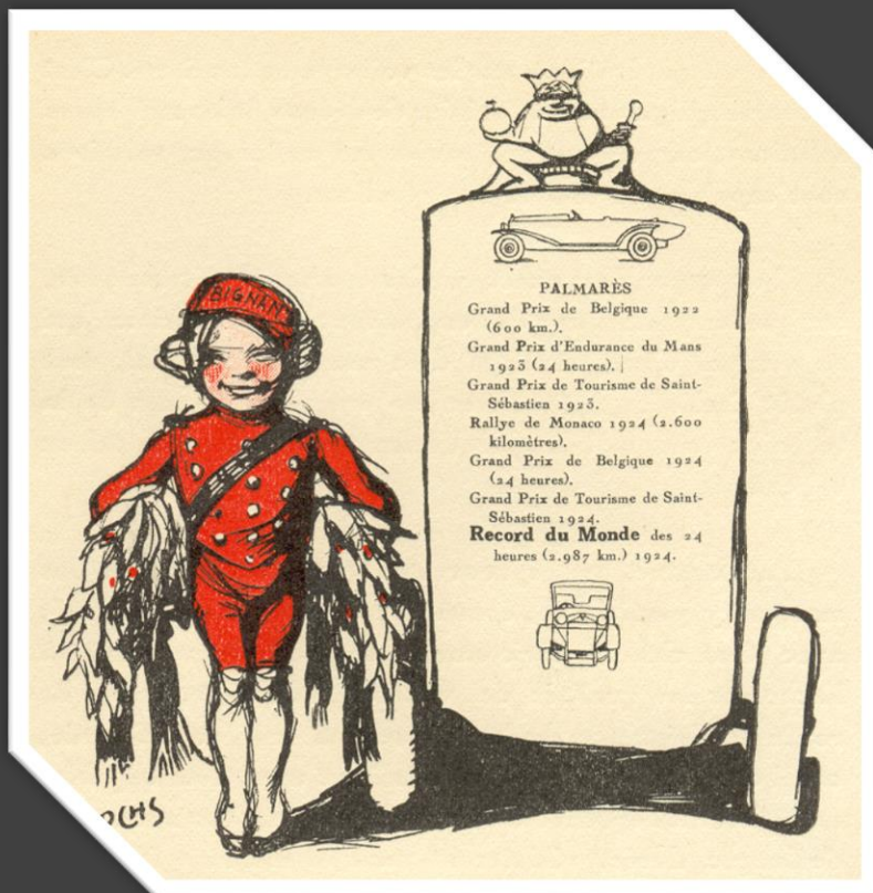
Dessins extraits d'un catalogue d'époque vantant les mérites des productions Bignan